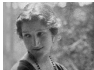
Antonieta Rivas Mercado