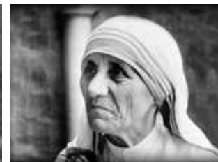
Madre Teresa de Calcuta