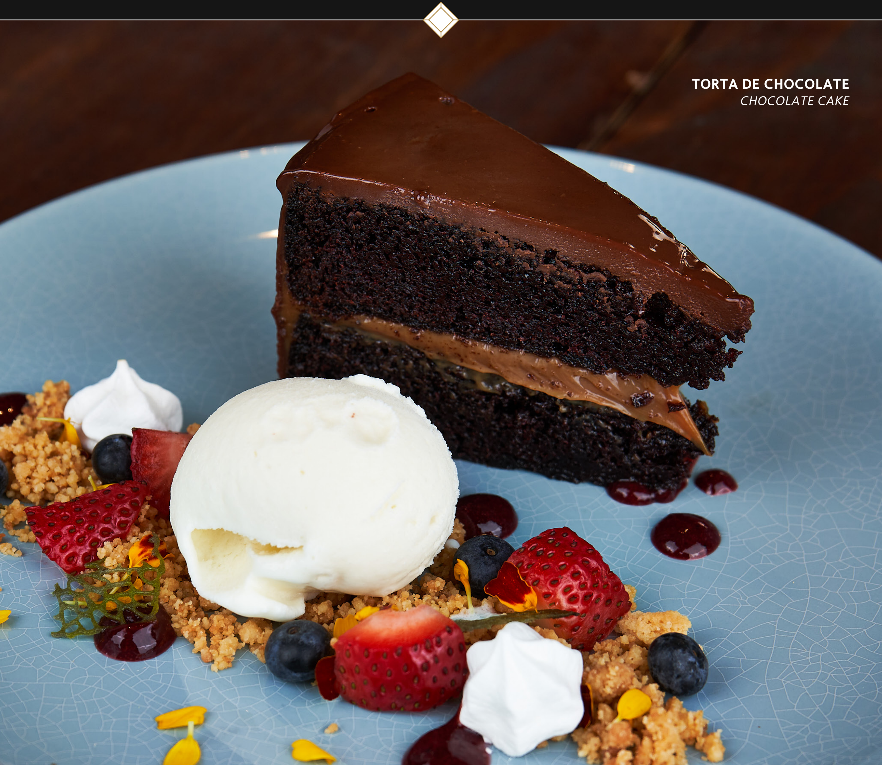
TORTA DE CHOCOLATE CHOCOLATE CAKE