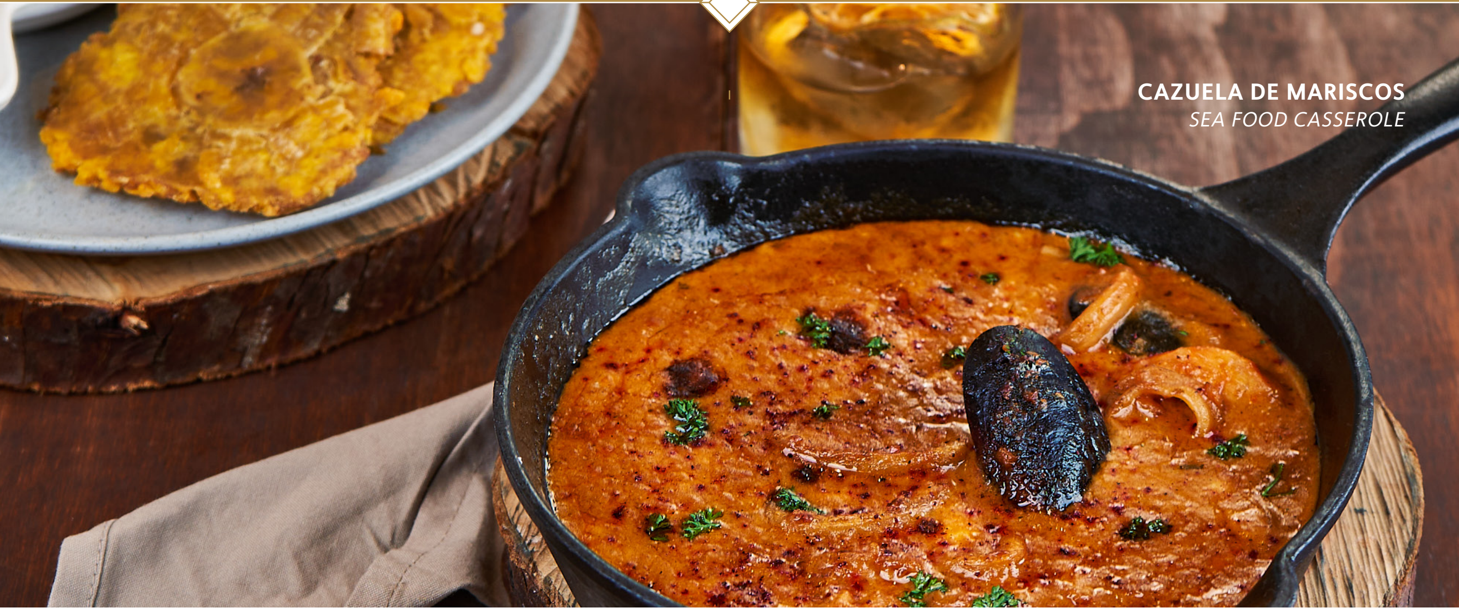
CAZUELA DE MARISCOS SEA FOOD CASSEROLE