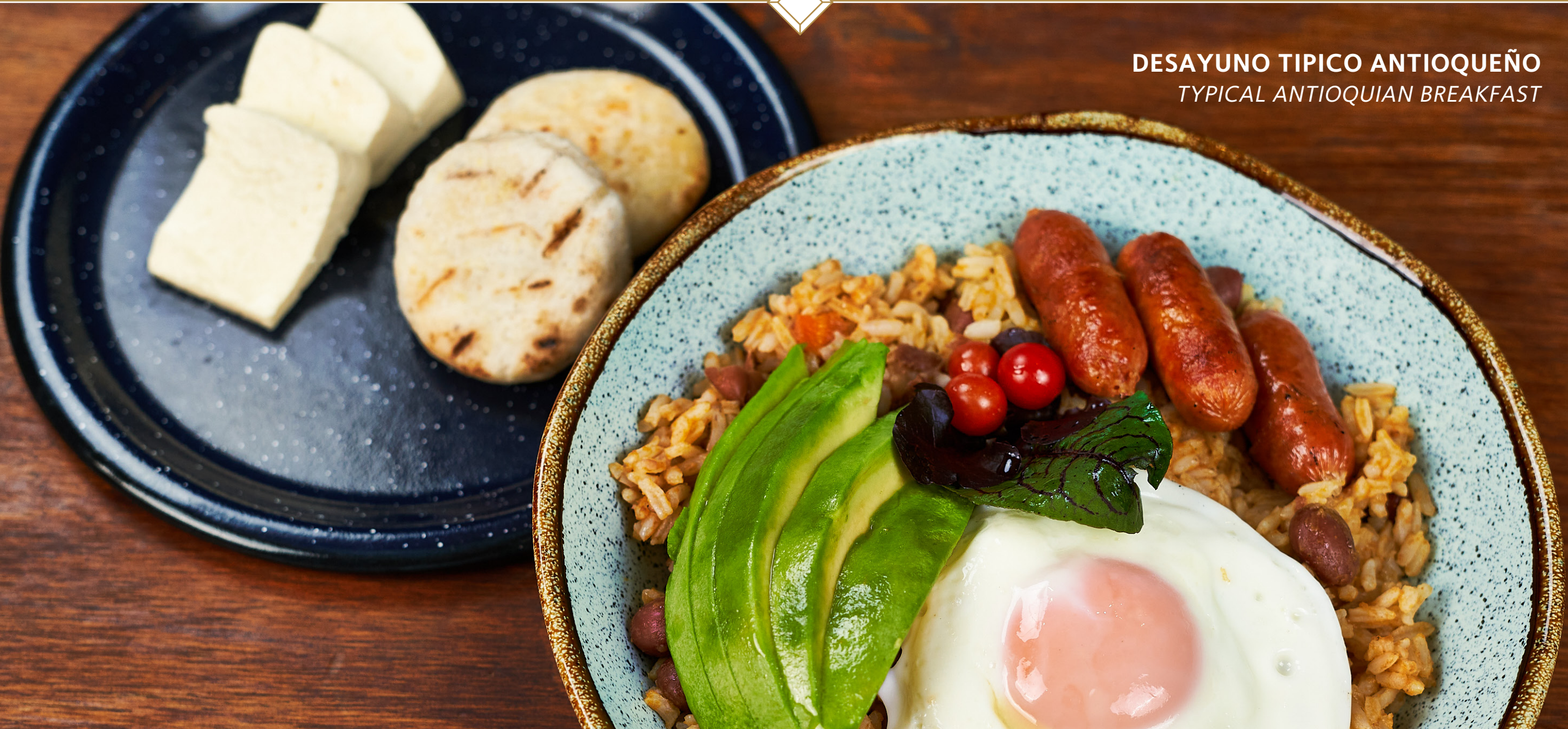
DESAYUNO TIPICO ANTIOQUEÑO TYPICAL ANTIOQUIAN BREAKFAST