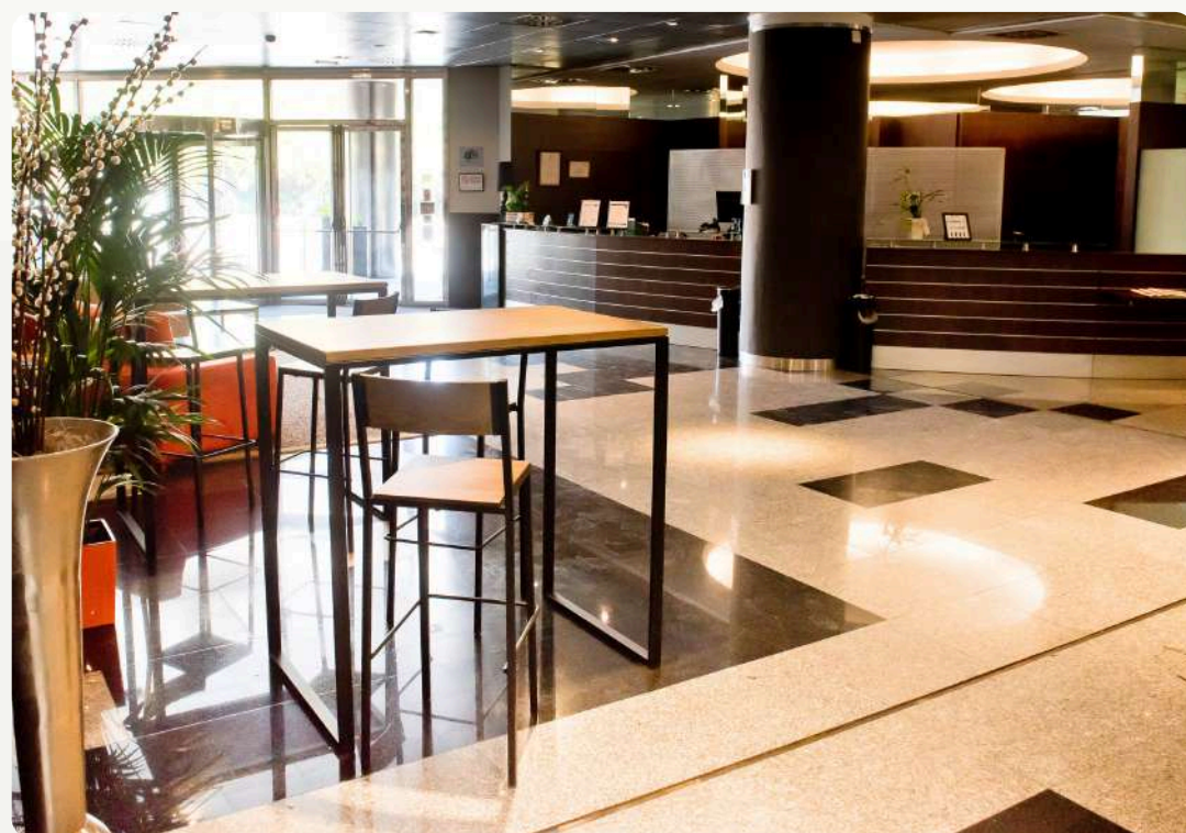
Hall Hotel Princesa de Éboli