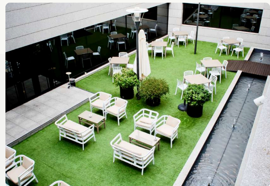
Terraza El Patio

Los más de 200m2 de nuestro Lobby, en la planta baja, se transforman durante el día para adaptarse a tus necesidades. Desayunar, picar algo en nuestro Snack-Bar ,trabajar con música de fondo o relajarse como en el salón de casa.